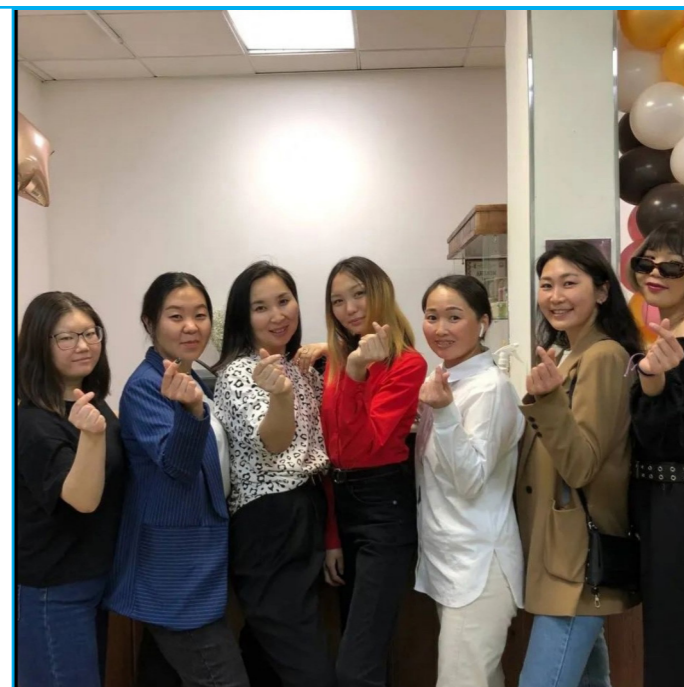
Фото сотрудников «Улаанса» из социальной сети кондитерской

-Да, наша начальница также считает. Она специально набирала в свой бизнес людей без опыта работы, чтобы научить их, поэтому наша этнокондитер-