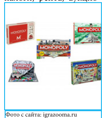
Фото с сайта: igrazooma.ru

Взяв с собой любую из приведенных выше игр,