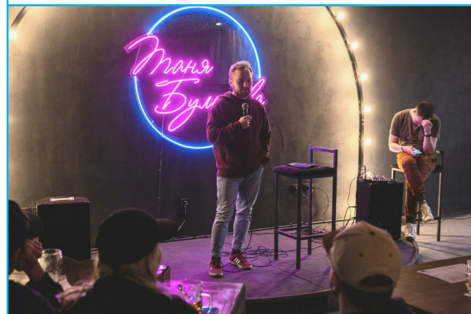
Резидент «Стендап Сибирь. Иркутск»

Его история и как развивается этот жанр в Иркутской области. В современное время стендап стал набирать большую популярность: различные комики собирают тысячные залы на своих концертах, а видео со стендап-выступлениями набирают сотни тысяч просмотров. Цитаты комиков разлетаются на цитаты и мемы, создается масса шоу, проектов, фестивалей для развития этого жанра. Откуда пошла истоки этой деятельности, кто был первопроходцем и как это искусство развивается в столице Восточной Сибири – читайте в этом материале.