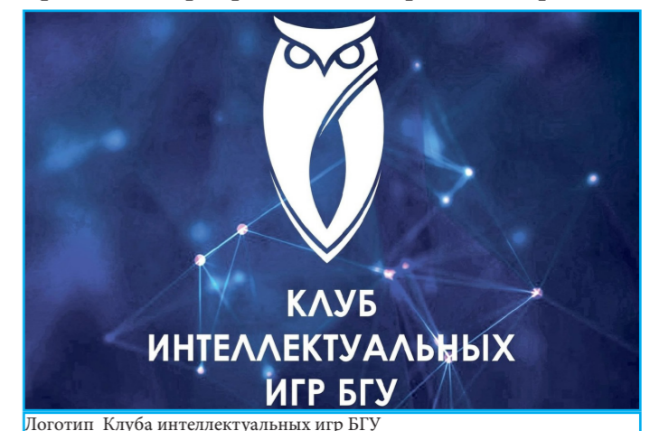
Логотип Клуба интеллектуальных игр БГУ

Сейчас, в 2022 году, клуб интеллектуальных игр БГУ, все также проводит подобные и другие мероприятия, которые направлены