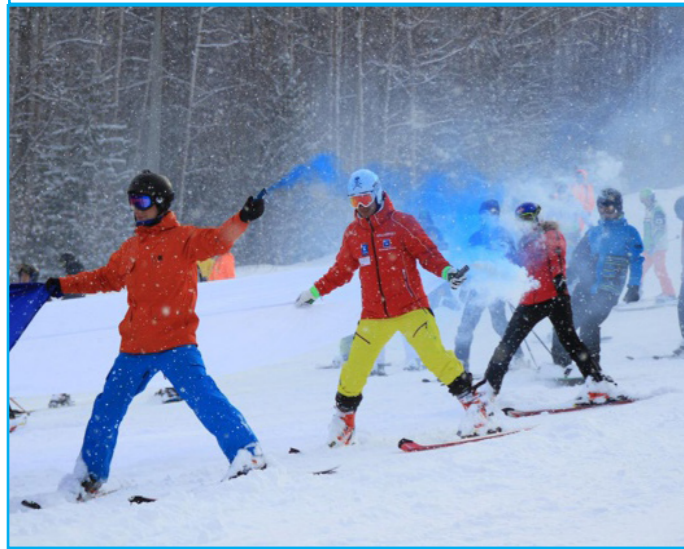
Посетители на «Горе Соболиной», фото с vk.com

«Путеводитель» для иркутян, чтобы активно провести выходные зимой. Зимняя пора — это не только про приближающийся праздник Новый год, но также и про долгожданные зимние каникулы, в планировании которых вам поможет следующий материал. В ней вы узнаете, где и как в Иркутской области можно отдохнуть и отлично провести свободное время в зимний период. Об этом и не только расскажет наш журналист далее.