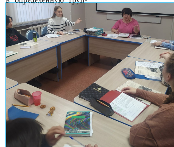
Студенты БГУ на курсах английского языка.

Лингвистический центр ловко спланирует ваши занятия так, чтобы вы могли совместить основную учебу